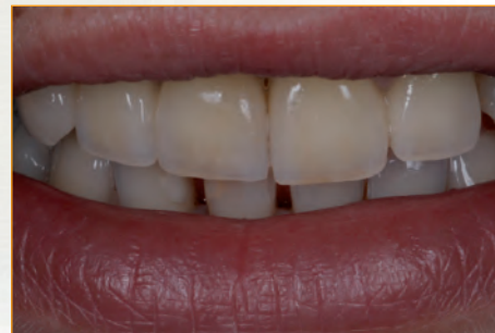
Zirkonkronen und -Brücken auf Implantaten