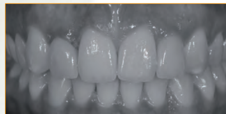
Veneer und Implantatkrone nachher