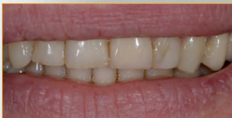
Vor der Behandlung mit Non-Präp-Veneers

Der Vorteil liegt neben geringeren Kosten gegenüber einer Krone oftmals in einer minimalen oder gar keinen Präparation (Non-Präp-Veneer) und damit geringen Schädigung Ihrer zu behandelnden Zähne. Vor der endgültigen