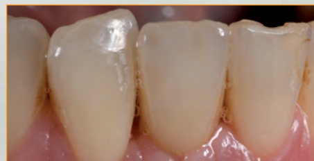
Implantatkrone aus Keramik