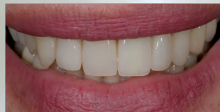
Ein perfektes Ergebnis – Veneers sehen natürlich aus und sind unsichtbar

Ob Veneers die richtige Lösung sind für Ihren Befund oder ob sie Ihre Wünsche an ein schönes Lächeln erfüllen, sollten wir gemeinsam mit Ihrem Zahnarzt besprechen.