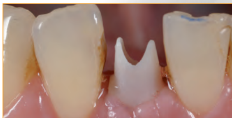
Implantataufbau aus Zirkon