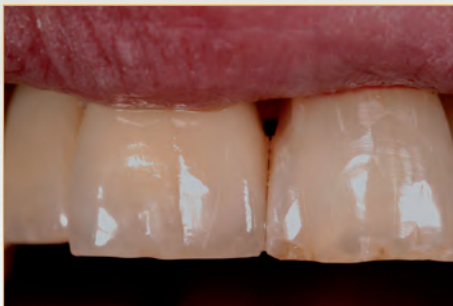
Zahn links hat eine Vollkeramikkrone

Es ist uns ein besonderes Anliegen, Ihren Patienten die bestmöglichen Lösungen für den Zahnersatz im Front- und Seitenbereich zu realisieren. Wir wissen, dass ästhetische Front- und Seitenzähne einen psychologischen Einfluss auf die Lebensqualität der Menschen haben. Deshalb freuen wir uns, wenn ihre Patienten wieder „richtig“ lachen können. Gemeinsam können wir sie auf diesem Weg begleiten.